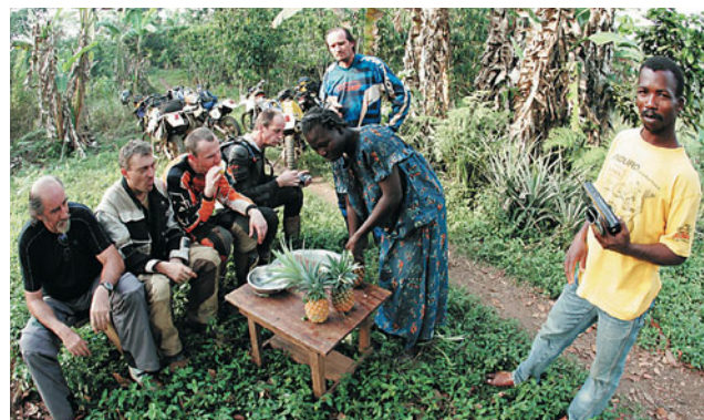
Ananas frais et Coupe d'Afrique des Nations à la radio...

Blitta, capitale du charbon, fin des vacances chez Tazan. On remonte vers la région natale de la famille présidentielle. Séjour à l'Hôtel Kara où le Premier Ministre est lui aussi descendu. Dans la piscine, des bidasses prennent un cours de natation. On n'est pas prêt de voir un Togolais aux JO d'été ! On retrouve l'ambiance des maquis urbains le soir avec leurs enceintes géantes qui crépitent sur la terrasse dans la rue. Au réveil, on trace vers l'aéroport international bien connu de Niamtougou, construit par le Président avec une piste qui pouvait accueillir le Concorde. Petite « variante » et on réveille un village en brousse où la sieste à même le sol semble de rigueur. Les pistes sont plates mais méandreuses. On jardine pour contourner un point d'eau et arriver de nuit au campement de Monsieur Siel au sommet d'un mont. On se croirait dans un lodge en Namibie. C'est impeccable et le réveil après une nuit à la belle étoile pour les volontaires est divin. La vue sur la plaine en contrebas est exceptionnelle. On y va à moto ! Faut bien le dire, le Togo que l'on a adoré est derrière nous. On remonte vers Ouaga, capitale du Burkina et ça sent le Sahel. Le Pays Kabé n'en reste pas moins magnifique