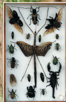
Avis aux botanistes, entre la bonne herbe du Ghana, y a aussi de drôles de bestioles!